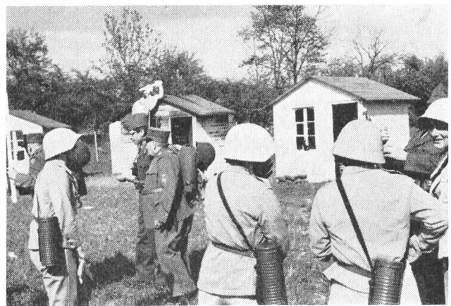
Mit dem Bekanntwerden der Mobilmachung treten aus allen Häusern die Wehrmänner, die dem Aufgebot folgen. Zurück bleiben die Frauen, die Alten und Kinder, um den Schutz von Heim und Familie zu übernehmen.