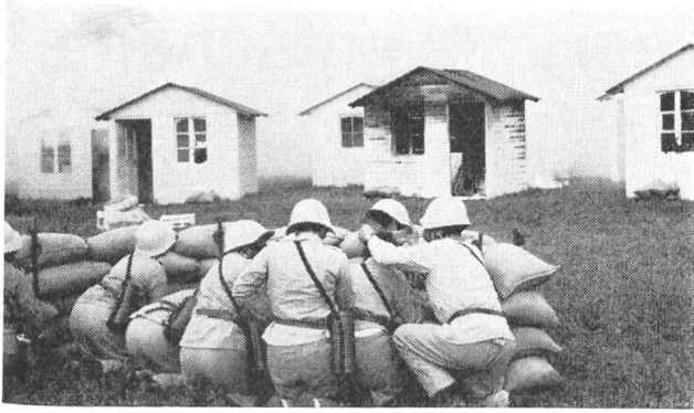
Die Hauswehren haben sich während des Bombardements in den Schutzraum zurückgezogen, denn auch sie müssen überleben, um helfen und retten zu können. (Der Schutzraum wurde sichtbar durch diesen Sandsackwall dargestellt.)