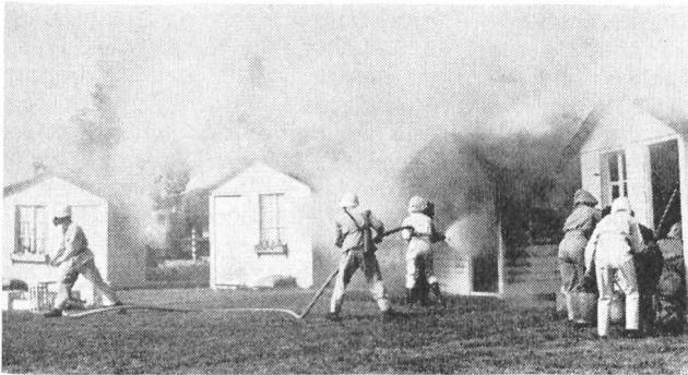
Nach dem Endalarm haben die Hauswehren den Schutzraum verlassen, um den Kampf gegen das verheerende Feuer aufzunehmen, während der Sandtrupp Phosphorbomben unschädlich macht.