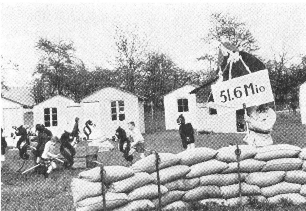
Während der Sprecher von den Abkommen und Verträgen spricht, die den Krieg ächten sollen, reiten die Kinder die Paragrafen-Steckenpferde im Dorf, und eine Tafel unterstützt den Hinweis darauf, wie gross die Ernte des Todes war. Trotz allen Vereinbarungen ist es immer wieder zu Kriegen gekommen.

anschaulichen und aktuellen Rahmen. Realistisch wirkten die aus der Höhe fallenden Brandkörper, die einige der Häuser trafen, Grossbrände entfachten, die dann von den vorgehenden Hauswehren in kürzester Zeit gelöscht wurden. Sehr gut hat uns vor allem das Konzept der Erklärungen gefallen, in die sich Frauen mit sympathisch warmer Stimme teilten und eine Männerstimme jene Stellen sprach, wo es auf klare Feststellungen und nüchterne Tatsachen ankam. Wir möchten an dieser Stelle die Stadtberner Vereinigung für Zivilschutz zu diesem Gemeinschaftswerk beglückwünschen, wie auch der Berufsfeuerwehr der Bundesstadt für die verständnisvolle Mitarbeit danken, die mit Unterstützung der BEA-Direktion erfolgreich neue und interessante Wege der Zivilschutzaufklärung boten. Der abschliessend in einem angrenzenden Filmraum gezeigte Streifen des Schweizerischen Bundes für Zivilschutz, «Wir können uns schützen!», hat den Besuchern einen ergänzenden Einblick in die Organisation des Zivilschutzes gegeben, nachdem das Spiel bewusst allein auf die Aufklärung über den Selbstschutz ausgerichtet war.