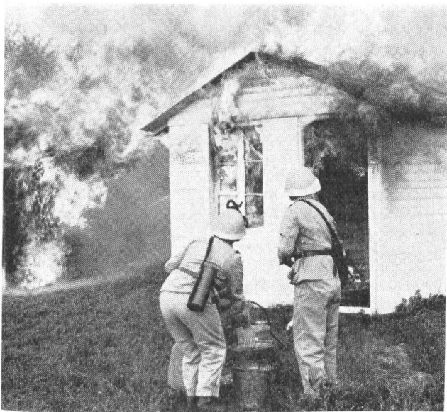
Mit der einfachen Eimerspritze, richtig bedient und den Wasserstrahl richtig gelenkt, können selbst grössere Brände in kürzester Zeit gelöscht werden. Voraussetzung: Man muss die Ausbildungskurse der Hauswehren besucht haben, und mit solchen oft gefährlich aussehenden Situationen vertraut sein, um den Kopf nicht zu verlieren und entschlossen handeln zu können.