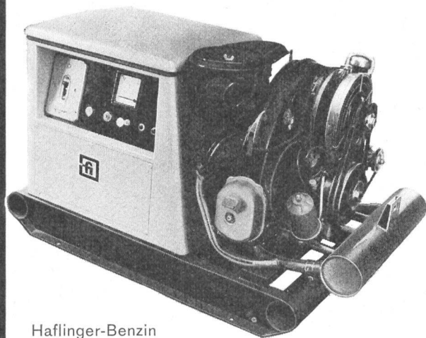
Haflinger-Benzin luftgekühlt, 10 kVA

Ersatzteillager und Werkstätte: ☎ (051) 88 96 52, 8955 Oetwil an der Limmat