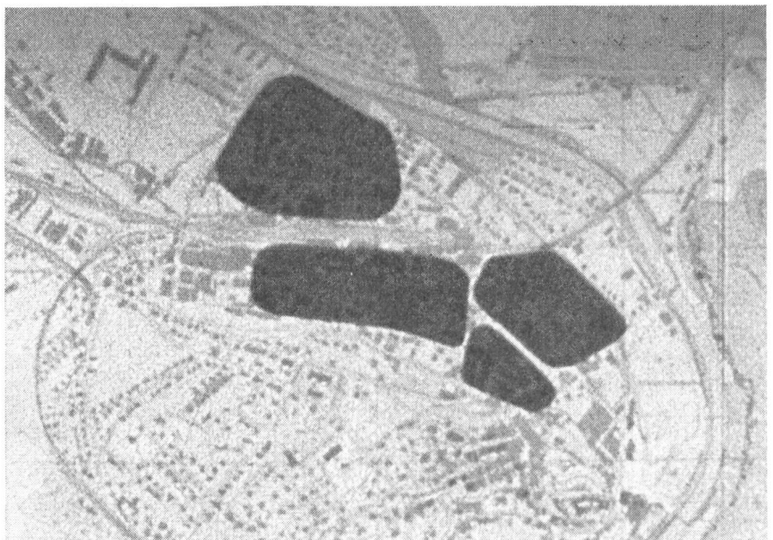
Mit diesem Kartenausschnitt, im erwähnten Instruktionsfilm beweglich mit Trick durchgeführt, werden in der Stadt Burgdorf die Ueberschwemmungsgefahren gezeigt.