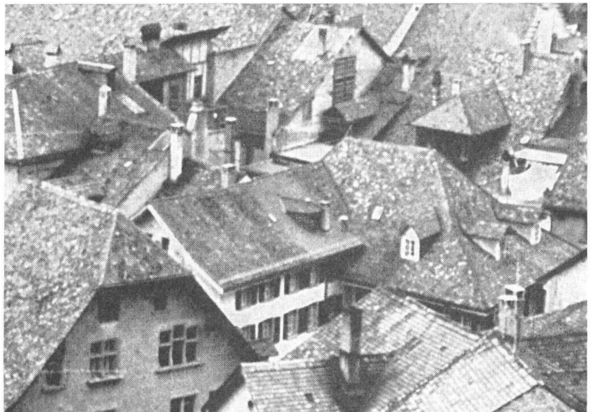
Die verschachtelten Giebel und Dächer der Altstadt mit viel Holzbauten bilden eine besondere Brandgefahr.