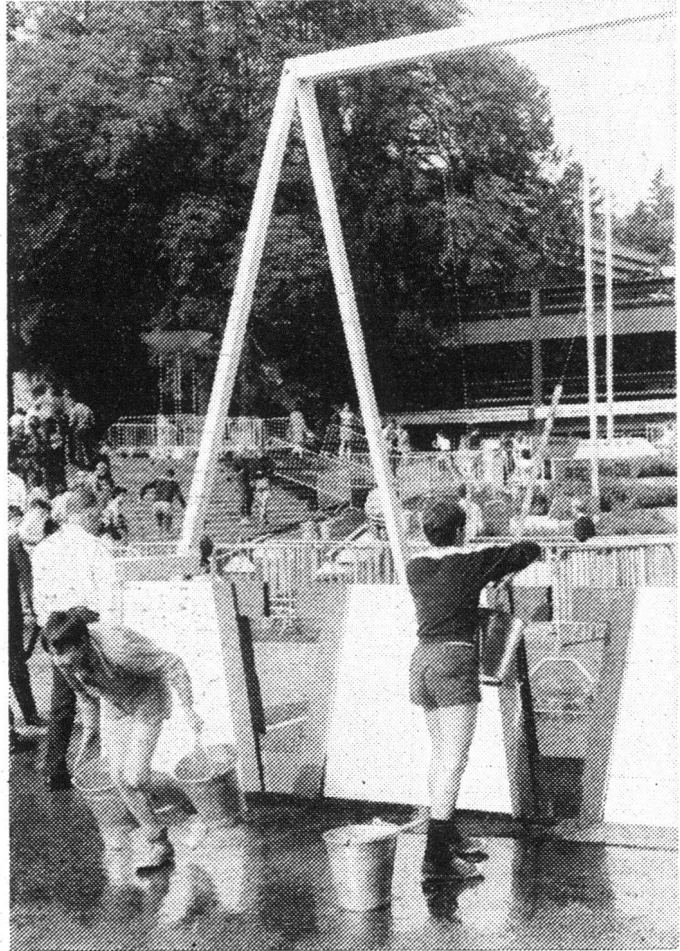
Unterwegs mussten die Wassereimer an dieses Pendelseil gehängt werden, das dann mit möglichst wenig Wasserverlust zu schwingen war, um den sich darunter supponiert befindlichen Graben zu überwinden