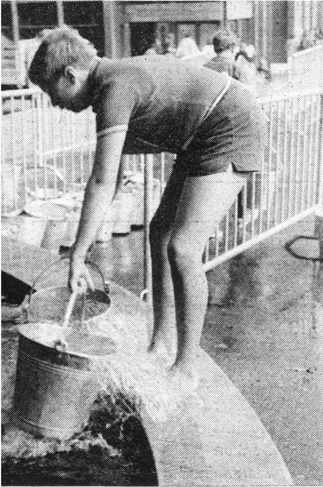
Bei diesem Weiher in der OLMA, die ihr Gelände für die Ausstellung und den Wettkampf zur Verfügung stellte, wurde mit dem Schöpfen des Wassers gestartet