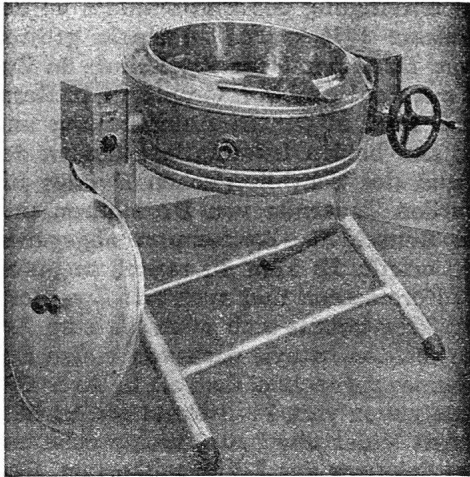
Bratpfanne Typ «Cantine»