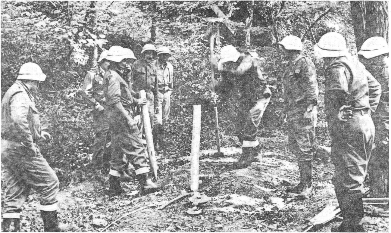
Préparatifs pour amarrage