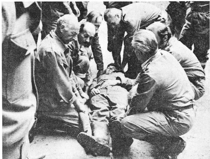
Les sanitaires au travail (exercice de transport)