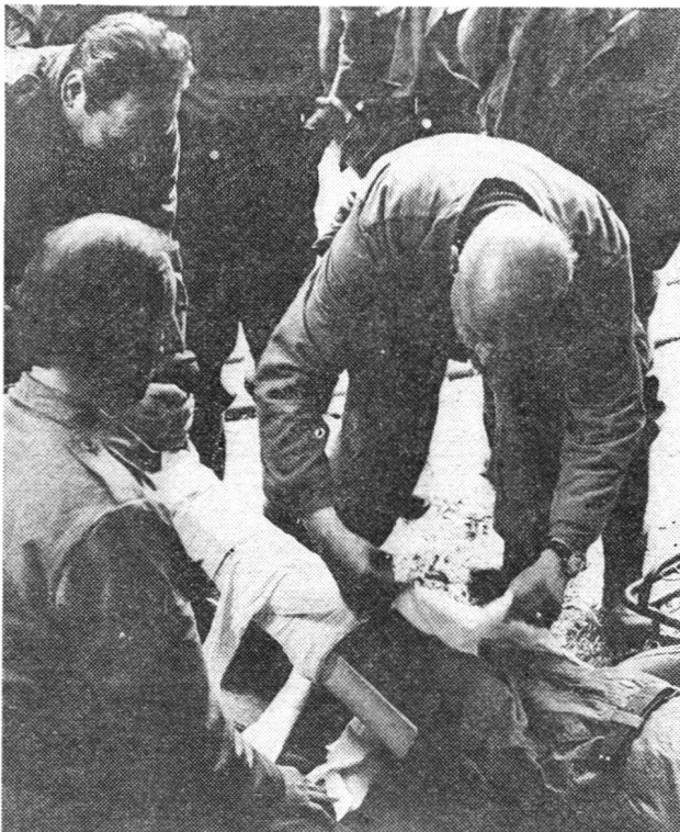
Nid de blessés