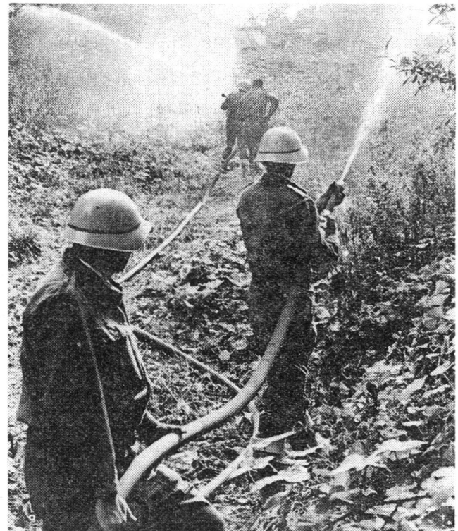
Sapeurs-pompiers de guerre en action