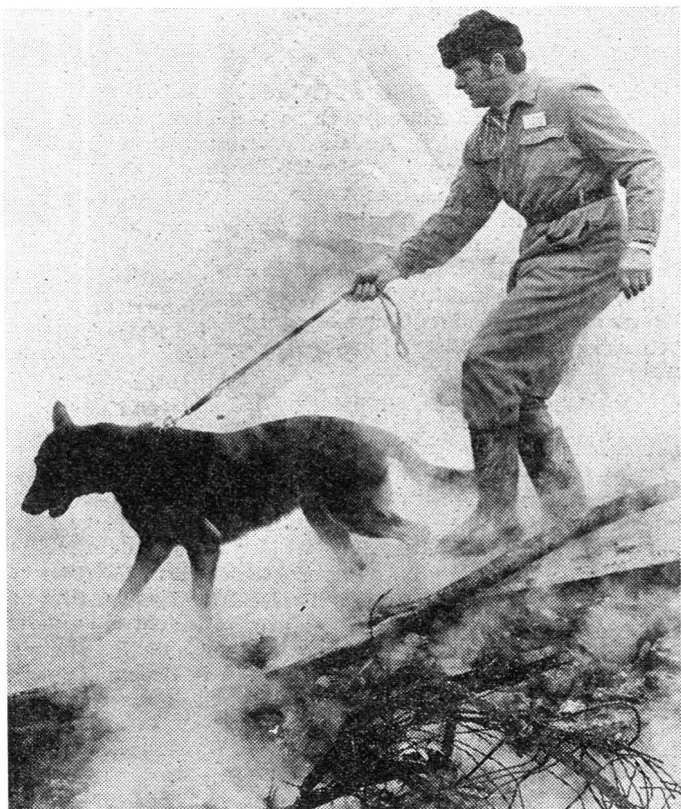
Ein Katastrophenhund bei Rauch, Lärm und unwegsamen Trümmern im Einsatz