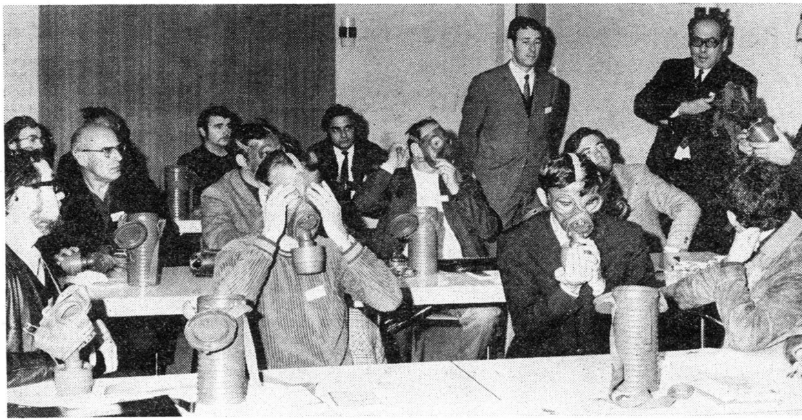
Interkantonaler Ausbildungskurs für A-Spürer in Horn