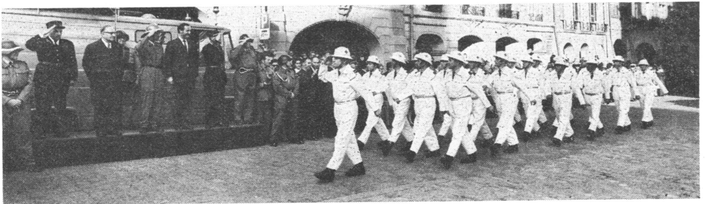
Vorbeimarsch der Sanitätspolizei