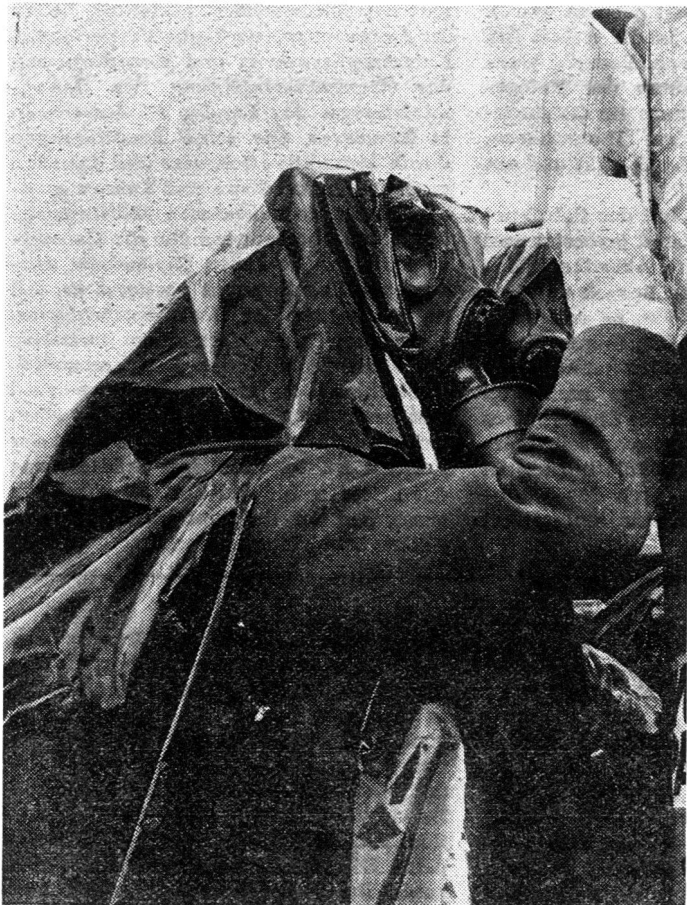
Führung des Messprotokolls beim Messposten