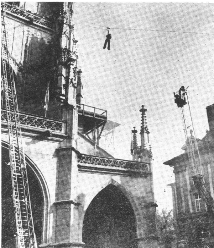
Rettung aus luftiger Höhe mit Seilbahn und Leitern