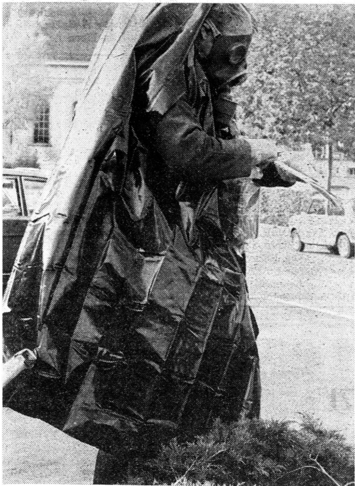
A-Spürer misst, indem er sich dreht, die Verstrahlung