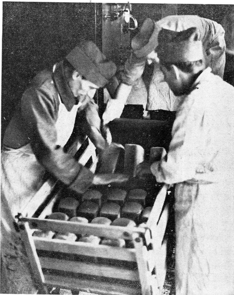
Moderne Feldbäckereien liefern der Truppe das tägliche Brot. Sie und die mobilen Armeemühlen müssen Mehl und Getreide in unmittelbarer Nähe aus Mühlen und Lagern beziehen können. Das ist aber nur möglich, wenn sowohl in geographischer Hinsicht als auch in bezug auf Anzahl und Grösse der Betriebe auf die kriegswirtschaftlichen Bedürfnisse Rücksicht genommen wird

dem Bund in Artikel 23bis BV die Aufgabe für die Erhaltung des einheimischen Müllereigewerbes zu sorgen. Seit es eine Brotgetreideordnung gibt, bestand und besteht denn auch innerhalb der getreidegesetzlichen Regelung eine Müllereiordnung . An Schutzmassnahmen für die Müllerei sieht Art. 23bis BV die Regelung der Backmehleinfuhr und die Gewährung von Frachterleichterungen für den Transport von Auslandgetreide im Inland vor. Die Einfuhrregelung für Backmehl schirmt wohl die einheimische Müllerei von der ausländischen Konkurrenz ab, trägt aber nichts zur Erhaltung ihrer dezentralisierten Struktur bei; sie dient heute in erster Linie als Schutz für den einheimischen Getreidebau vor der ausländischen Konkurrenz. Die Frachterleichterungen für den Transport von ausländischem Getreide im Inland wurden unlängst aufgehoben und können deshalb der Dezentralisierung des schweizerischen Müllereigewerbes nicht mehr dienen.