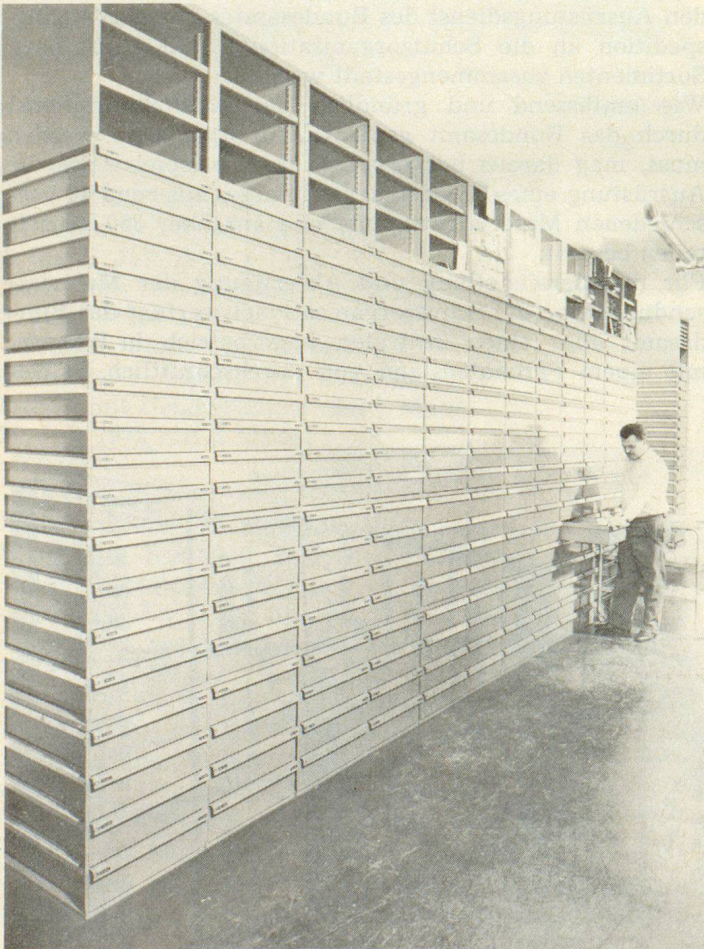
Teilansicht des Ersatzteillagers

Der Versand des Materials der technischen und persönlichen Ausrüstung an die Gemeinden und Betriebe erfolgt