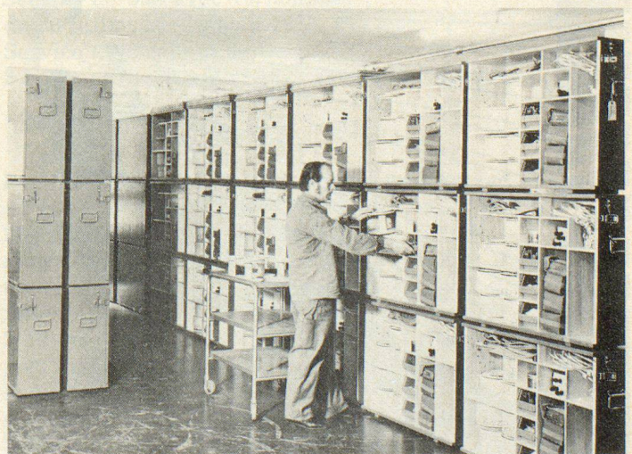
Ausrüsten von Kisten des Uebermittlungsdienstes