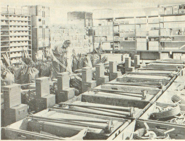
Ausrüsten von Sortimenten

diensteten. Der Umfang des Materialumschlages, der durch den Lagerbetrieb jährlich bewältigt werden muss, geht aus der nachstehenden Aufstellung hervor: