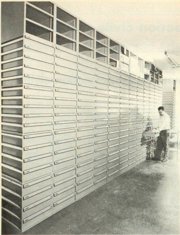
Vue partielle de l'entrepôt des pièces de rechange