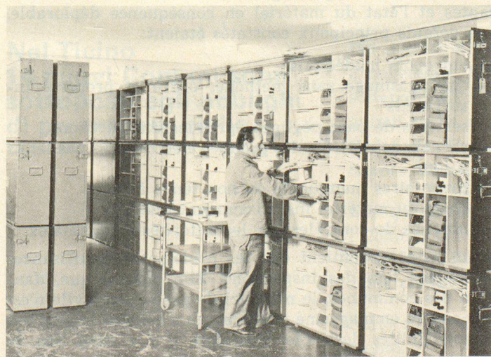
Equipped de caisses du Service des transmissions