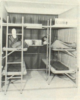
Kranke müssen besonders betreut werden