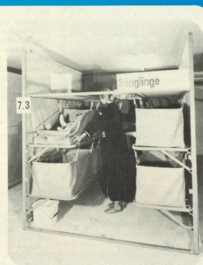
Ablagen für die persönlichen Effekten müssen eingeplant werden