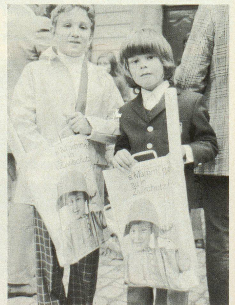
Zwei dankbare zukünftige Zivilschutz-Angehörige!