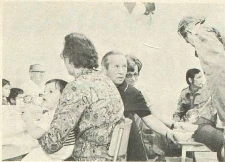
▲ Die Verpflegung im Schutzraum, ein besonderes Problem für sich, das den jeweiligen Örtlichkeiten und Umständen angepasst werden muss

blem, das vordringlich bei der Ausbildung berücksichtigt werden muss. Wir haben schon im letzten Beitrag auf die besonderen Probleme der Alten, der Kranken, der Kinder und Säuglinge hingewiesen, für die zweckmässige Lösungen gefunden werden müssen. Dazu kommen der Wasserhaushalt, die Sanitäreinrichtungen, die Verpflegung und alle jenen kleinen Dinge des täglichen Lebens, an die auch unter der Erde gedacht werden muss und die im Rhythmus des Schutzraumlebens dazu geeignet sind, ohne besonderen Zwang eine bestimmte Ordnung und damit auch Disziplin zu organisieren und zu halten. Im Tagesprogramm eines Schutzraumes, wo die äusseren Einflüsse mit ihren Stress- und Reizanfälligkeiten fehlen, werden gerade diese kleinen Dinge von grösster Bedeutung und zu Fixpunkten eines geordneten Lebens.