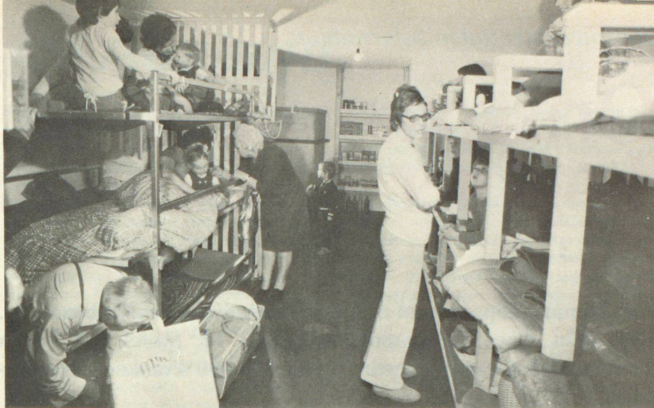
▲ Alte und Junge, Gesunde und Gebrechliche, sie alle müssen im Schutzraum zusammenleben und miteinander auskommen. Jeder sollte sich für jeden verantwortlich fühlen

blem, das vordringlich bei der Ausbildung berücksichtigt werden muss. Wir haben schon im letzten Beitrag auf die besonderen Probleme der Alten, der Kranken, der Kinder und Säuglinge hingewiesen, für die zweckmässige Lösungen gefunden werden müssen. Dazu kommen der Wasserhaushalt, die Sanitäreinrichtungen, die Verpflegung und alle jenen kleinen Dinge des täglichen Lebens, an die auch unter der Erde gedacht werden muss und die im Rhythmus des Schutzraumlebens dazu geeignet sind, ohne besonderen Zwang eine bestimmte Ordnung und damit auch Disziplin zu organisieren und zu halten. Im Tagesprogramm eines Schutzraumes, wo die äusseren Einflüsse mit ihren Stress- und Reizanfälligkeiten fehlen, werden gerade diese kleinen Dinge von grösster Bedeutung und zu Fixpunkten eines geordneten Lebens.