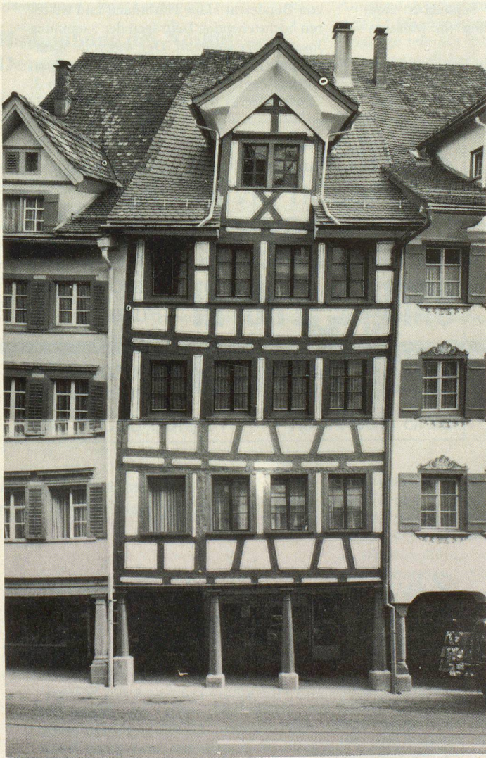
Photogrammetrische Aufnahme in der Hauptstrasse von Lichtensteig SG

Diesem Zweck diene der «Internationale Kurs