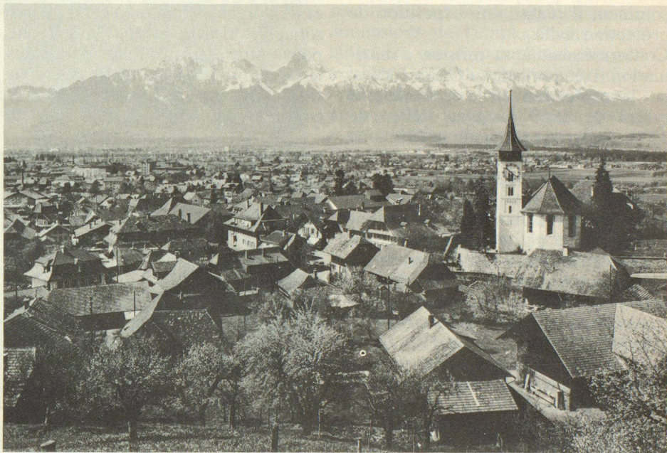
Steffisbourg avec la chaîne du Stockhorn

Le programme prévoit une série d'exposés sur la protection civile dans le cadre de la défense générale, ainsi que plusieurs visites d'installations à Steffisbourg, Thoune, Spiez/Gesigen, Berne, Ostermundigen, Meiringen et Sempach. La journée du 1er octobre sera particulièrement intéressante, car