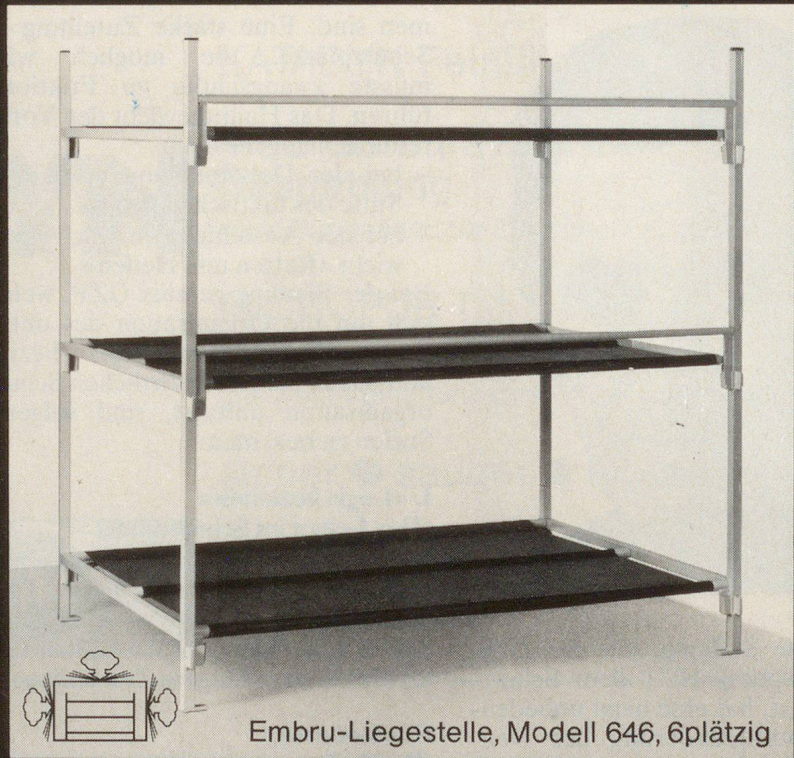
Embru-Liegestelle, Modell 646, 6plätzig

Embru ist Generalunternehmer für die Lieferung von über 20000 Liegestellen, samt Einrichtung der notwendigen Zusatzräume, wie Block-Leitungen, Quartier-Leitungen, Toilettenanlagen usw.