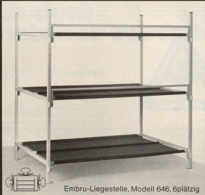
Embru-Liegestelle, Modell 646, 6plätzig

Embru ist Generalunternehmer für die Lieferung von über 20000 Liegestellen, samt Einrichtung der notwendigen Zusatzräume, wie Block-Leitungen, Quartier-Leitungen, Toilettenanlagen usw.