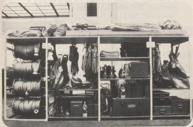
Armoires, étagères pour matériel et pour effets.