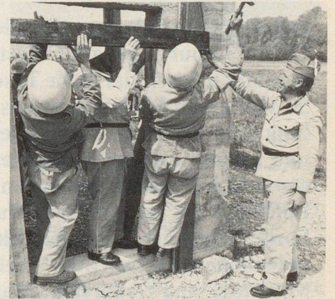
Feuerwehrmann der Bundesstadt als Klassenlehrer im Zivilschutz.