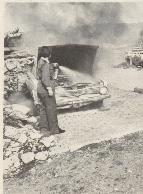
Entstehungsbrände wie Kurzschlüsse, Vergaser-, Polsterbrände usw. sind mit dem Handfeuerlöcher zu bekämpfen. Feuerlöcher, die in der untersten Ecke des Kofferraumes gelagert sind, verlieren ihre Daseinsberechtigung. Sie müssen in Griffnähe montiert sein.