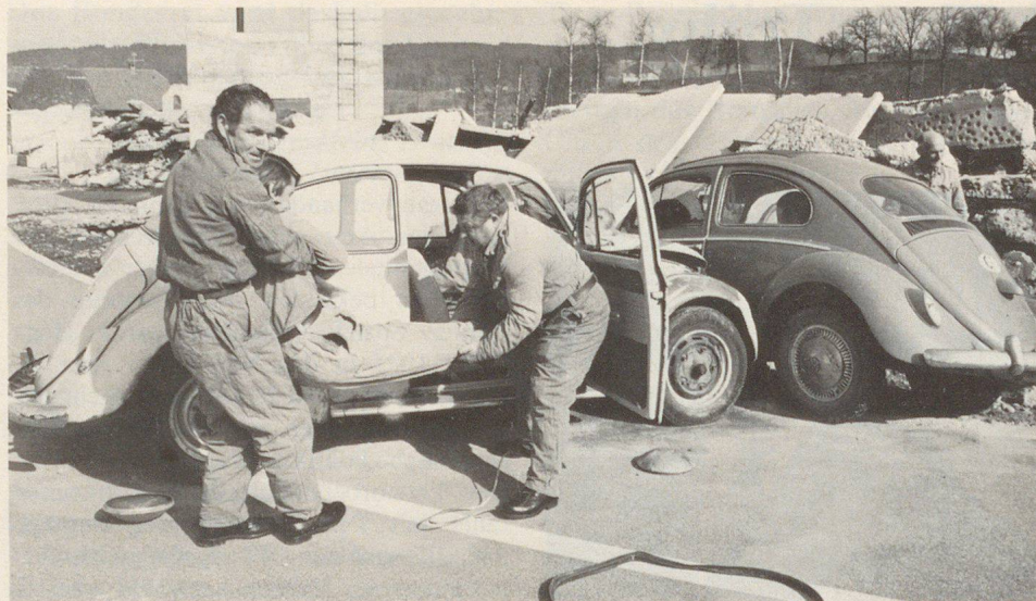
Frontalkollision: Hier wird der Ernstfall geübt. (Überblick verschaffen, Gefahren erkennen, Unfallstelle absichern, Selbstschutz, Bergen, Lebensrettende Sofortmassnahmen, Alarmierung von Polizei und Sanität, Überwachung der Verletzten, Auskunft an Polizei und Sanität.)

Realistische Übung auf dem Zivilschutzausbildungszentrum Schötz als Schwergewichtsbildung in den diesjährigen Wiederholungskursen. Jahr für Jahr verunfallen allein bei Strassenverkehrsunfällen in der Schweiz zwischen 30 000 und 40 000 Menschen. Eine Situation, die scheinbar unabwendbar ist und die wir beinahe als eine Gegebenheit unseres heutigen Lebens betrachten. Eine traurige Bilanz auch, die noch negativer wird, weil aufgrund von ärztlichen Untersuchungsergebnissen feststeht, dass viele der fast 2000 Verkehrstoten gerettet werden könnten, wenn im Moment der Lebensbedrohung einfache, zur Lebensrettung notwendige Handgriffe von den Anwesenden angewandt würden. Zuerst der Mensch – dann erst die Frage nach der Schadhaftung und der eventuellen Strafbarkeit. Nicht der Ruf nach der Polizei, sondern die Sorge um den Verunfallten ist nach einem Verkehrsunfall dringend.