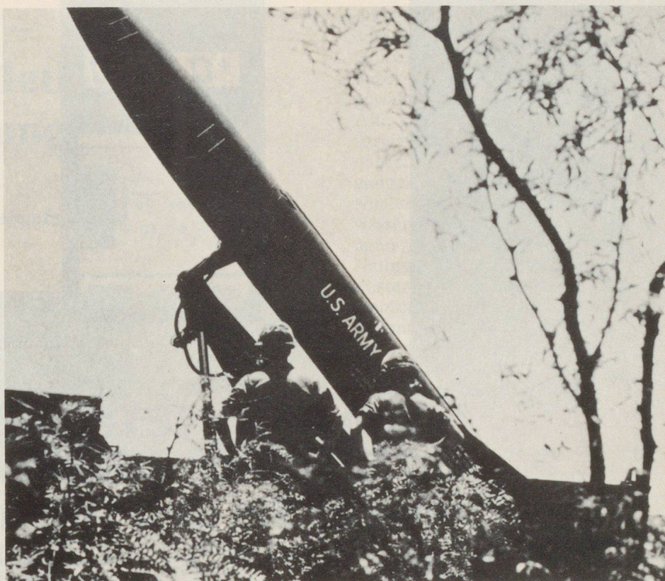
Abb. 3. Dieses amerikanische Raketensystem «Lance» wird in den Nato-Staaten seit 1973 eingesetzt. Die Reichweite liegt zwischen 8 und 120 km. «Lance» kann mit konventionellem oder nuklearem Sprengkopf verwendet werden; es ist für den Einsatz von Neutronenwaffen vorgesehen.

Nimmt man beispielsweise das Kriterium von 8000 rad für den Einsatz einer Neutronenwaffe gegen mechanisierten Gegner an, so ergibt sich bei einem Radius von rund 800 m eine Schadenfläche von 2 km 2 , worin mit Sicherheit alle Besatzungen innert Minuten kampfunfähig werden.