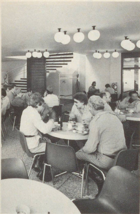
Die Eingangshalle im Erdgeschoss, die für Zwischenverpflegungen als Cafeteria ausgebaut wurde.