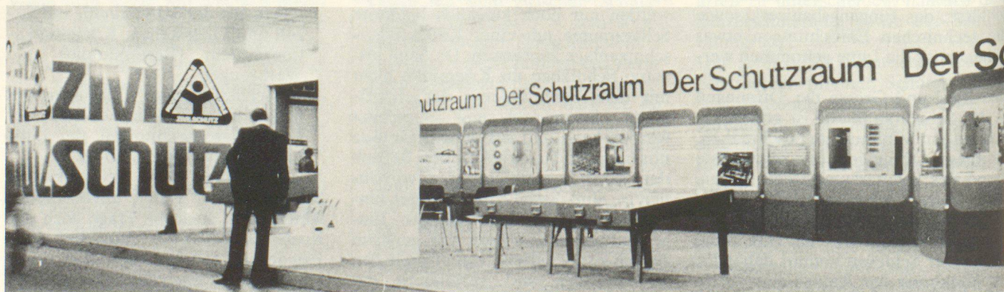
Die Darstellung in Bild und Wort wurde ergänzt durch die Modelle der verschiedenen Schutzraumtypen. Fachleute standen bereit, um Auskunft zu geben und zu beraten.

Mit Inkrafttreten dieser Weisungen wird eine noch bestehende Lücke geschlossen, so dass es künftighin allen im baulichen Zivilschutz Tätigen möglich sein wird, anhand der ihnen zur Verfügung stehenden Weisungen die für einen wirkungsvollen Schutz unserer Bevölkerung erforderlichen Schutzbauten im Hinblick auf das gesteckte Ziel zu konzipieren und zu realisieren.