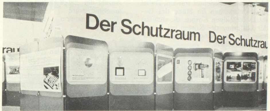
Blick in die Ausstellung «Baulicher Zivilschutz» an der Swissbau 79, gestaltet von der Stabsstelle für Information im Bundesamt für Zivilschutz.

Die Zahl und Grösse der Öffnungen in der Schutzraumhülle ist grundsätzlich auf ein Minimum zu beschränken, da diese Öffnungen das schwächste Glied des Schutzraumsystems bilden. Die beste Schutzraumhülle nützt nichts, wenn im Moment einer Atomexplosion per Zufall eine Türe offen steht. Der Schleuse kommt daher für die Sicherheit der Anlage eine grosse Bedeutung zu. Sie ist als Druckschleuse gedacht, wobei vorausgesetzt wird, dass die hintereinander ange-