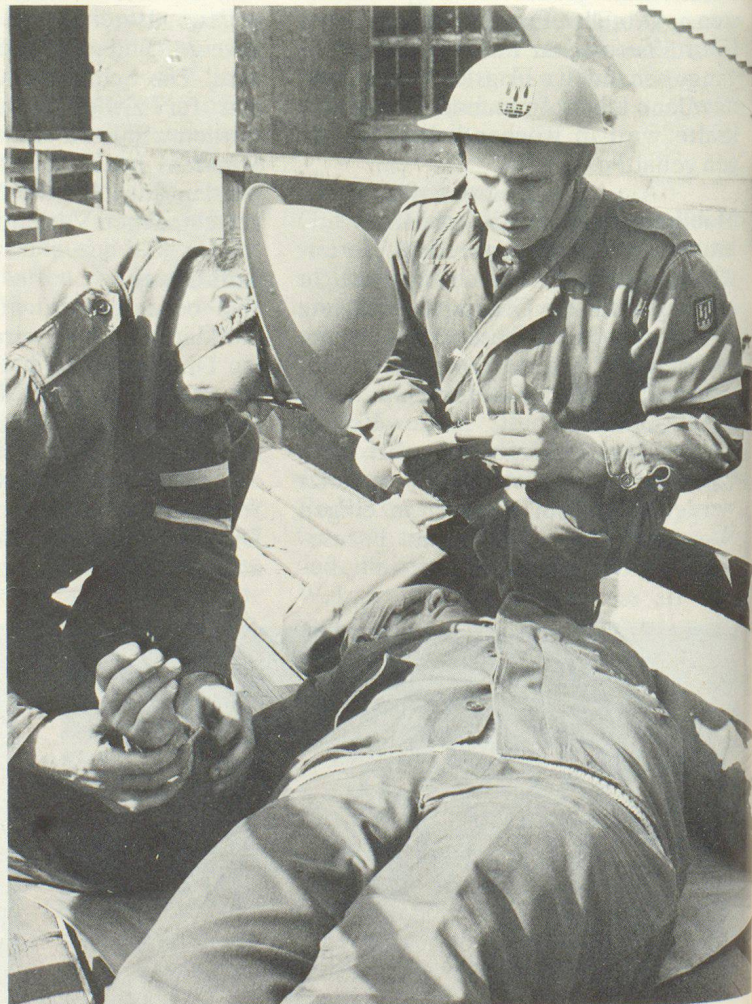
Die Ausbildung in der Ersten Hilfe gehört zur Grundausbildung aller Frauen und Männer im Zivilschutz