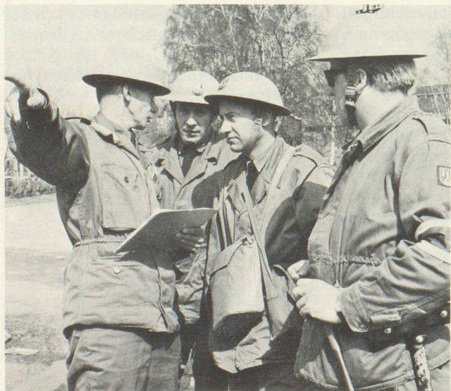
Einsatzbesprechung im Lager einer Fernhilfe-Kolonie