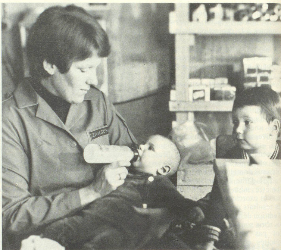
Ci si deve preoccupare anche dei neonati.

I rifugi servono ben poco se non sono mantenuti in esercizio a dovere, muniti delle necessarie attrezzature e gestiti regolarmente. Il Manuale colma una lacuna nella documentazione per la direzione e l'istruzione nella protezione civile e vuole con ciò promuoverne l'efficacia.