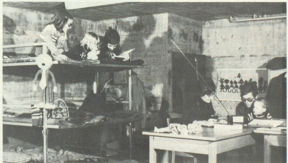
Exemple d'un abri équipé de dortoirs préfabriqués qui peuvent être acquis dans diverses firmes suisses.