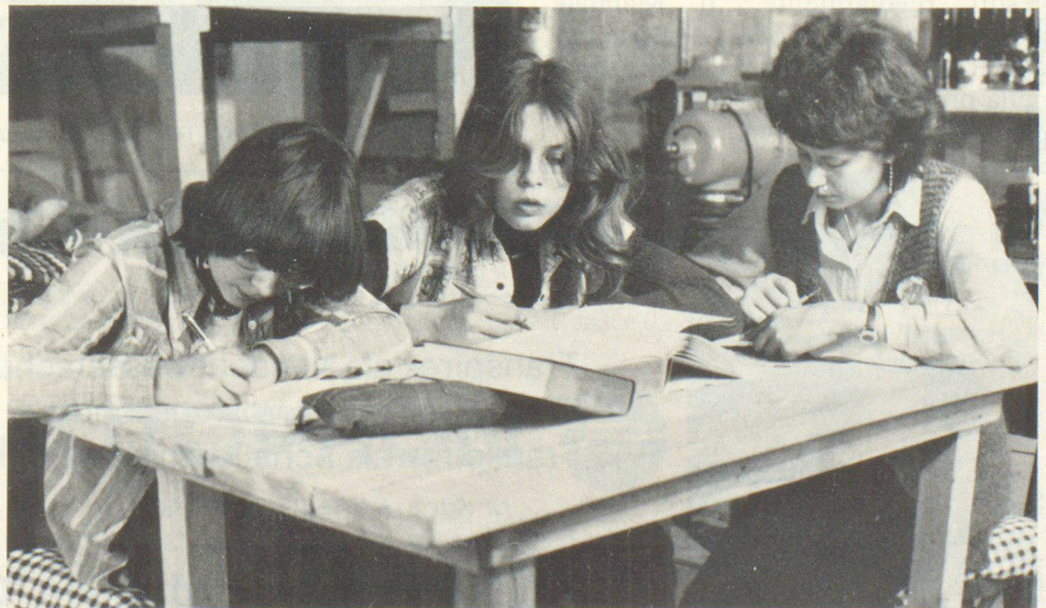
Vivendo nel rifugio è molto importante preoccuparsi di come far occupare il tempo ai giovani e agli anziani.