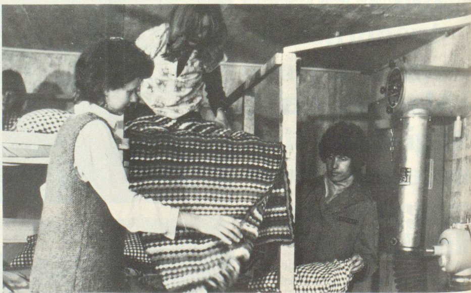
Rifugio occupato da una famiglia in casa propria.