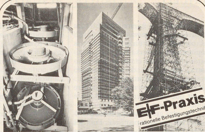
Schwerstbefestigungen Fassadenverkleidungen Betonverbindungen

Beschlägefabrikation Wilerweg 37, Telefon (062) 21 40 03