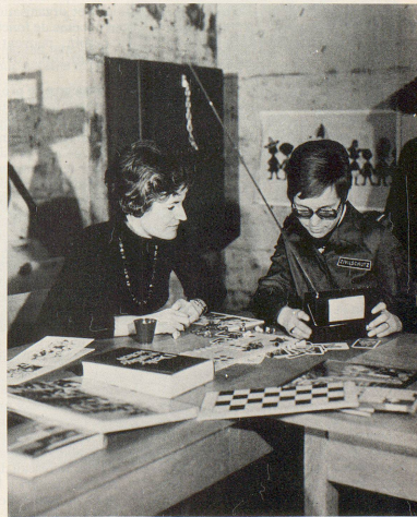
Zivilschutz 7/8 83

Des moyens d'information disponibles, la presse, la radio et la télévision, seule la radio est en mesure de remplir les conditions mentionnées. Elle seule permet d'atteindre en temps utile tous les milieux intéressés, de les informer, de les mettre en garde contre les dangers qui les menacent et de leur communiquer les instructions et directives nécessaires. La presse ne fonctionne pas faute de temps, non plus