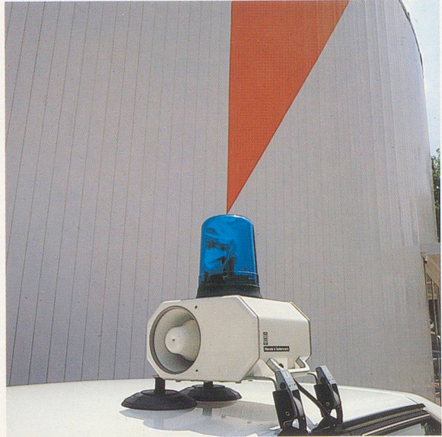
Kleiner Dachträger DT-10