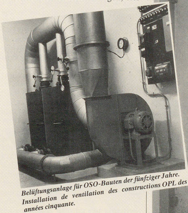
Belüftungsanlage für OSO-Bauten der fünfziger Jahre. Installation de ventilation des constructions OPL des années cinquante.

Wenn wir die Entwicklung der baulichen Massnahmen im Zivilschutz in den letzten 30 Jahren verfolgen, stel-