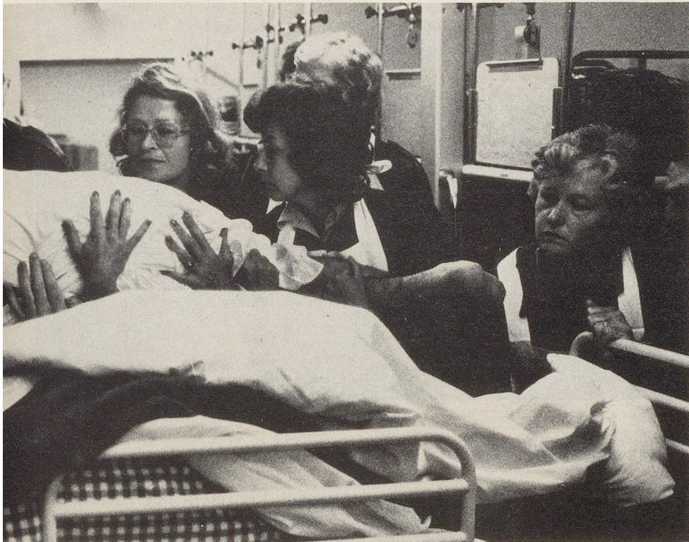
Behinderten richtig einzubetten.