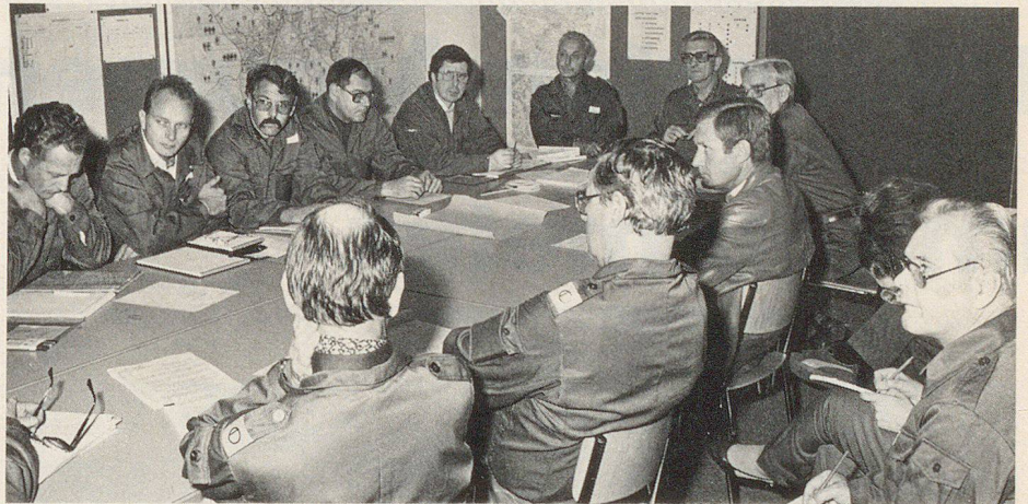
Rapport der Ortsleitung und der Sektorchefs mit einem Mitglied des Stadtrates

diesen Dienstanlass mit Sicherheit nicht in so konzentrierter Form zu erfassen gewesen wären. Lehrstück oder Examen? – Die Stabsrahmenübung war beides in hohem Masse, nicht allein für den beübten Verband, sondern auch für die Übungsleitung. Es bleibt zu hoffen, dieser kurze Bericht trage Früchte und ermutige eine möglichst grosse Zahl Verantwortlicher im Zivilschutz-Vollzug, sich der Stabsrahmenübung als einer hervorragenden Methode praxisbezogener, auf den Ernstfall ausgegerichteter Ausbildung zu bedienen.