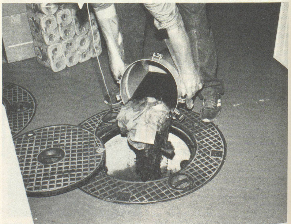
Anders als im Zivilschutz: Fäkaliengrube.

Für das Abwaschen mit wenig Wasser ist ein effizientes Verfahren ausprobiert worden. Das Geschirr wurde mit Zeitungsschnitzeln sorgfältig gereinigt, dann in einer Lösung mit Abwaschmittel nachgewaschen und im Wasser nachgespült. Als Abwaschmittel ist ein Geschirrspülmittel mit einem Entkeimungsmittel zu verwenden. Handabwaschmittel enthalten allgemein keine desinfizierenden Zusätze. Mit dem gewählten Abwaschverfahren wurde ein höheres Hygiene-