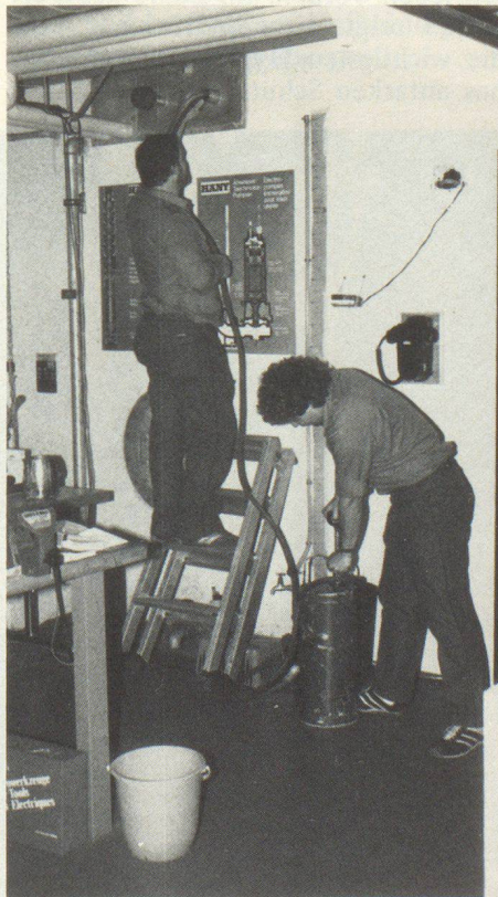
Die Chlorungssubstanz wird mittels Eimerspritze in den Tank gepumpt.

Um die Verkeimungsgefahr des Tankinhalts während des Belegungsversuchs untersuchen zu können, wurde anstatt der im Reglement festgelegten Chlorierung von 2 mg/l lediglich 0,2 mg/l eingebracht. Obwohl zeitweise der Chlorgehalt auf 0,03 mg/l sank, trat keine relevante Verkeimung auf.