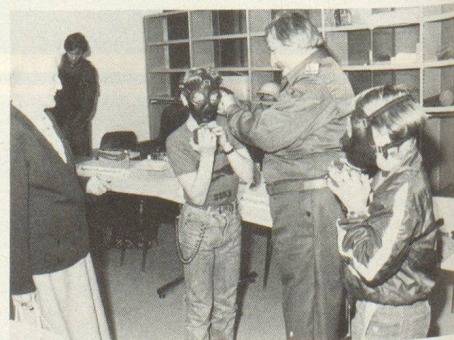
Tag der offenen Tür in Thun/Martinstrasse: Schutzmasken-Anprobe bei der Jungmannschaft.