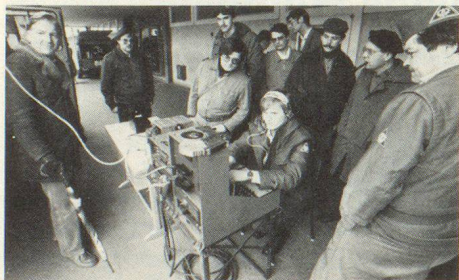
Unser Bild zeigt eine Demonstration einer Fernmeldestelle des deutschen Katastrophenschutzes.

adr. Im März besuchten auf Einladung 39 Mitglieder mit zehn Einsatzfahrzeugen der Fernmeldezüge Freiburg im Breisgau und Göppingen der bundesdeutschen Katastrophenschutz-Organisation und des «Technischen Hilfswerkes» unseres nördlichen Nachbarlandes die Zivilschutzanlage Windisch. Bei diesem erstmaligen, grenzüberschreitenden Zivilschutz-Gedankenaustausch mit speziellem Blick auf die hüben wie drüben (überlebens-)wichtigen Übermittlungsdienste wurde wohl viel gefachsimpelt – aber auch die Pflege der Kameradschaft kam nicht zu kurz.