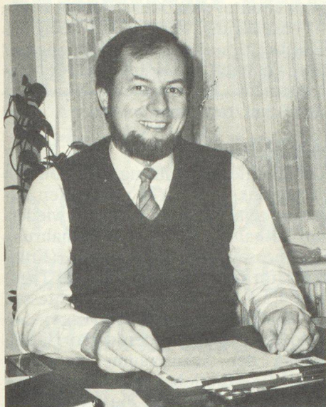
Peter Bolinger, Vorsteher des Amtes für Zivilschutz des Kantons Zug: «Blosse Abmachungen mit einem Lagerhalter, im Ernstfall eine bestimmte Menge Lebensmittel zu liefern, genügen nicht.»

Kanton Zug reservierten Waren im Bedarfsfall (z. B. bei Sabotage, Brand usw.) auch an einem andern Ort, das heisst im nächstgelegenen Prodega-Markt, zur Verfügung zu halten.