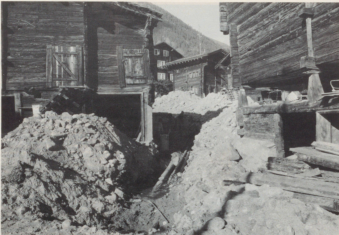
So sah es mitten im Dorf Münster aus.