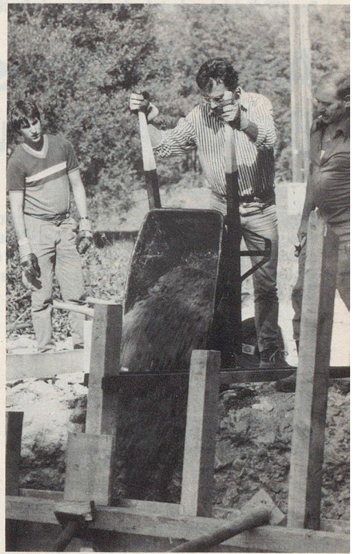
Viel Muskelkraft war gefragt.