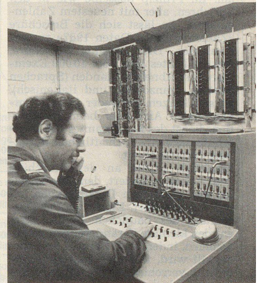
Zur Infrastruktur im Ortskommandoposten gehört auch die Telefonzentrale.