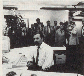
Besichtigung im Betrieb der BAZ (Basler Zeitung).