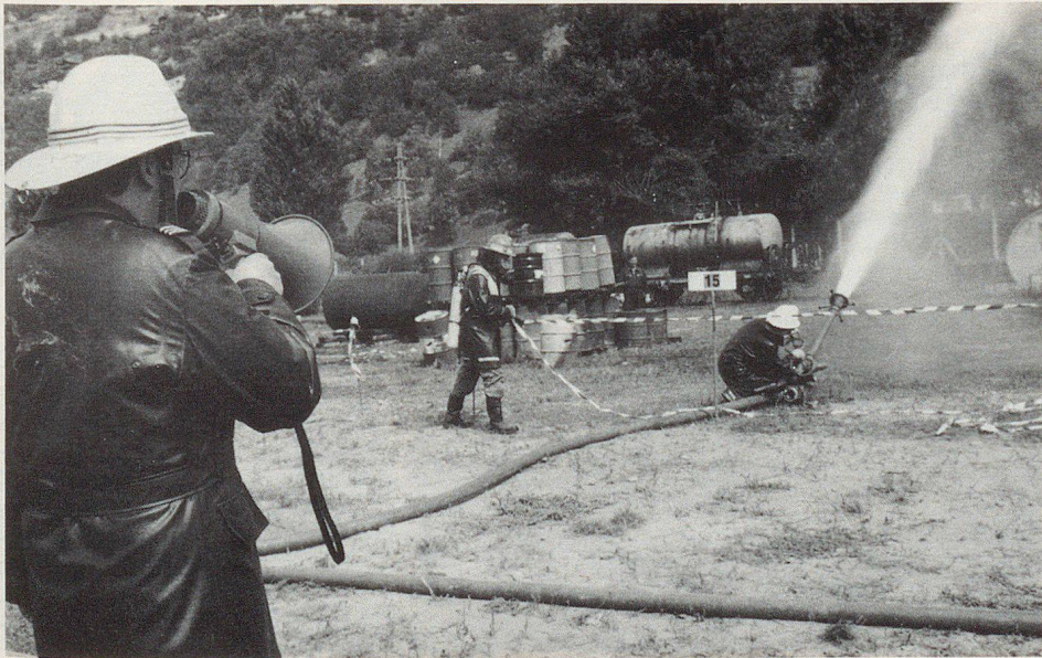
Pompieri o protezione civile: è una condotta chiara che determina il successo di un intervento.

Tutti gli autocarri che trasportano merci pericolose devono portare, su una tavola di colore arancio, il numero di codice internazionale dei materiali trasportati. I pompieri possono così rilevare rapidamente di quali prodotti chimici si tratta e decidere quindi le misure da adottare. In pratica, tuttavia – come risulta da prove eseguite a caso – più di un'autocisterna circola portando indicazioni scorrette. Nell'interesse della sicurezza, i pompieri auspicano quindi che la polizia abbia in avvenire a procedere a un numero maggiore di controlli. ▀