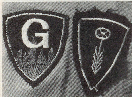
Pas peu fier de ses connaissances: ce sapeur-pompier est spécialiste de la protection contre les gaz et chauffeur.

L'une des principales difficultés est d'identifier les produits chimiques contre lesquels il s'agit de se prémunir. Les appareils permettant d'analyser immédiatement sur le lieu du sinistre en sont toujours au stade expérimental. Le problème se complique encore si plusieurs produits chimiques, mélangés en un «cocktail» explosif, sont incriminés. Aussi, le principe de la défense chimique est-il le suivant: surtout ne rien entreprendre qui soit erroné.