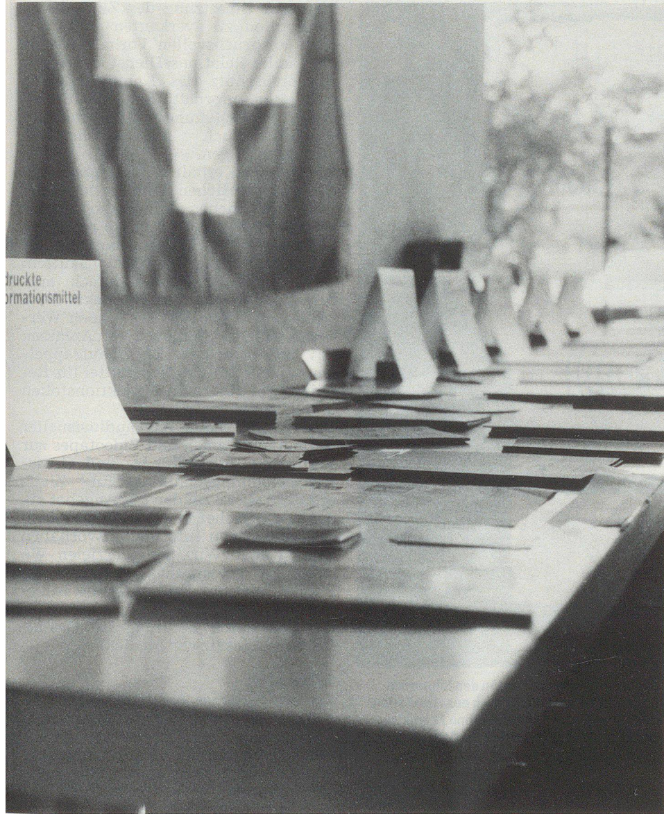
Eine kleine Ausstellung präsentierte die Medienangebote des KAZS.