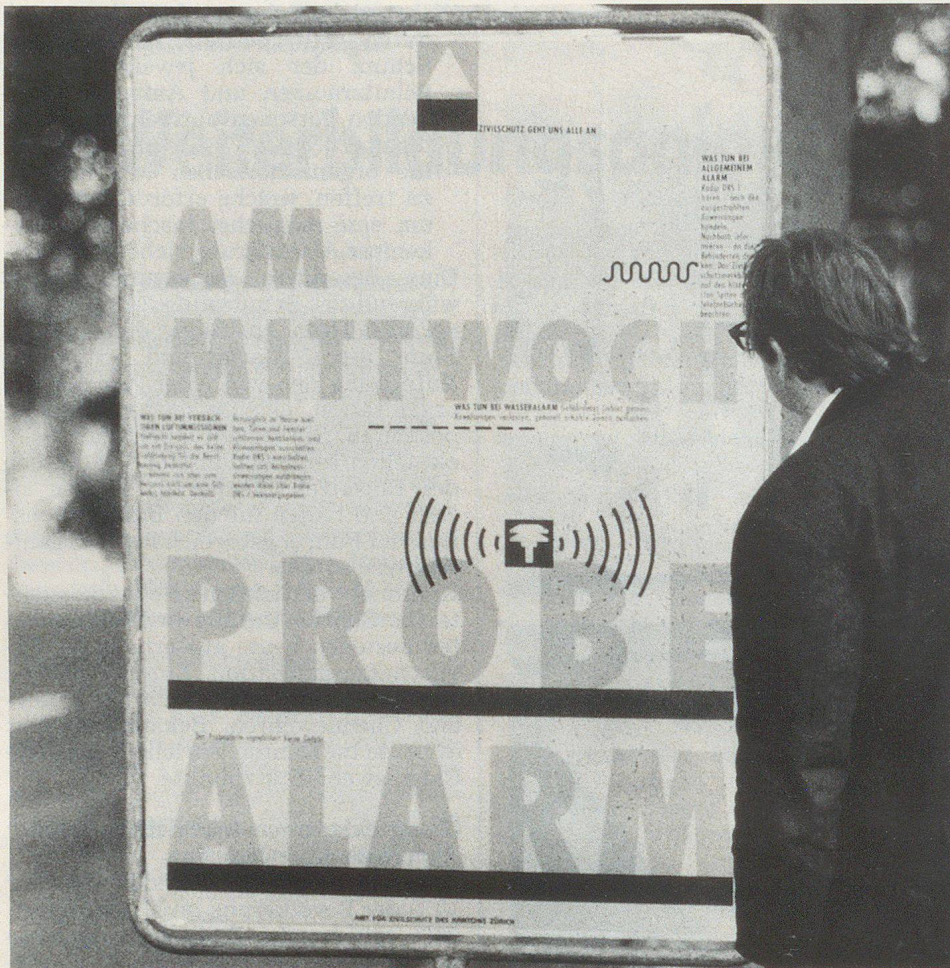
Das auffällige, modern gestaltete Plakat spricht zwei verschiedene Zielgruppen an. An den fahrenden Verkehrsteilnehmer richtet sich der sehr gross geschriebene, leicht lesbare und lediglich aus vier Worten bestehende Hinweis «Am Mittwoch Probe-Alarm». Damit ist eine optimale Information ohne Ablenkung der Fahrzeuglenker sichergestellt. Der Fussgänger wird in deutlich kleinerer Schrift an die Bedeutung der Alarmierungssignale und das richtige Verhalten erinnert.

eigentümern gerade noch einen Dienst und erhalten auch Gelegenheit, den Einwohnern den einen oder anderen Hinweis und Tip zu geben.