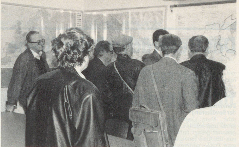
Reges Interesse zeigten die vielen Besucher.

Und wie sagte der Architekt? «Die fehlende Kreativität habe ich damit gelöst, dass ich in Zusammenarbeit mit der Baukommission wenigstens die vielen Rohrleitungen mit bunten Farben habe bemalen lassen.»