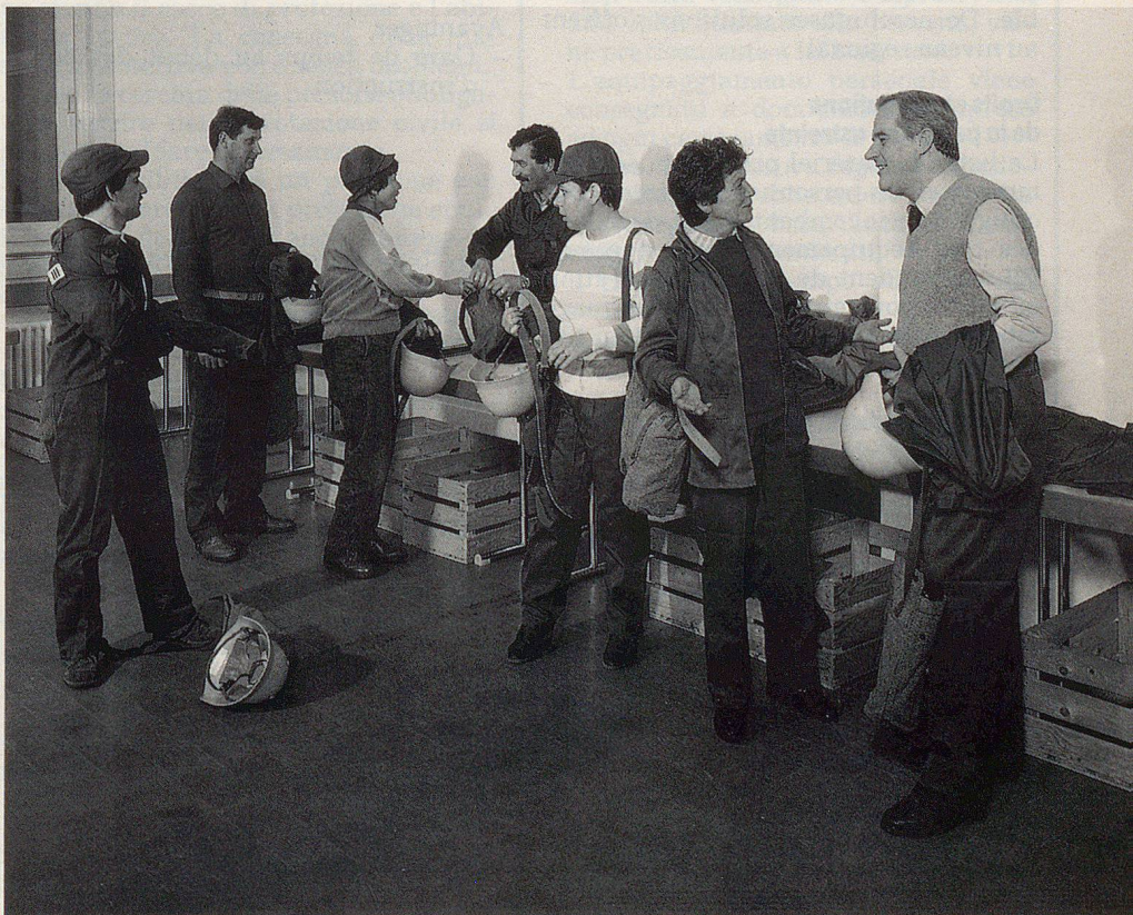
Les personnes astreintes à servir dans la protection civile devront-elles bientôt conserver leur matériel à la maison?

Il semblerait judicieux de confier la remise de cet équipement à des organes proches des destinataires. Plusieurs so-