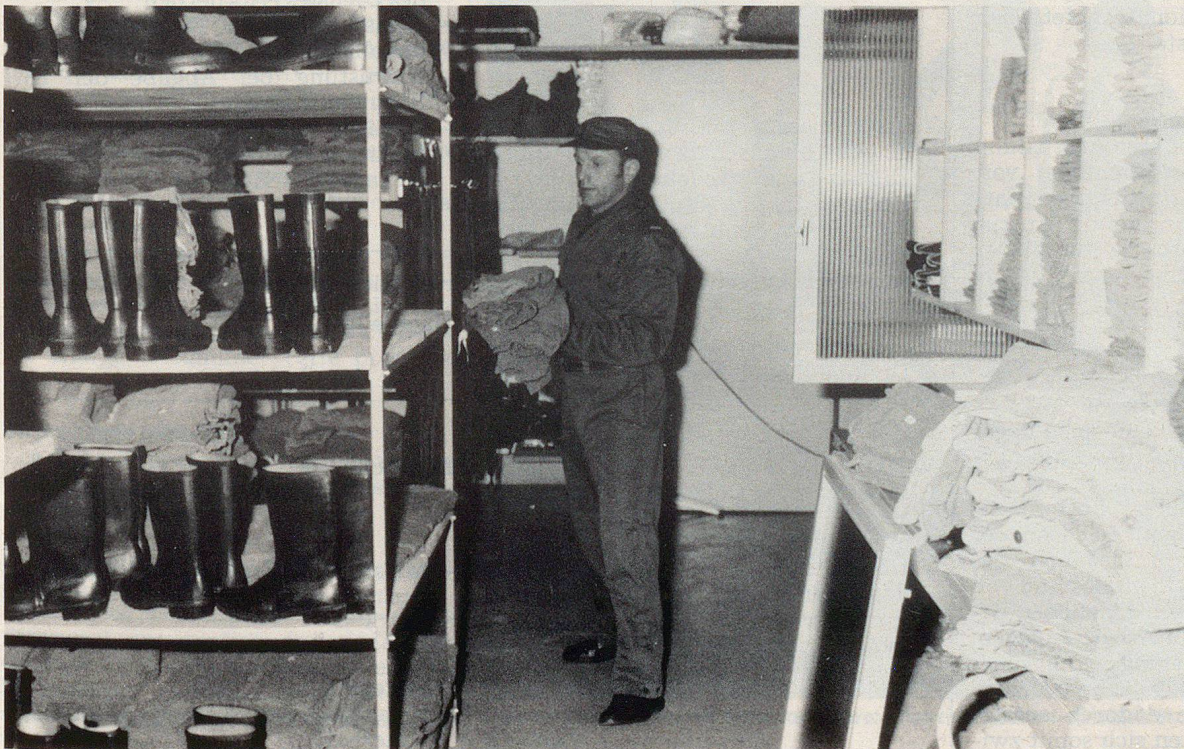
Nehmen die Schutzdienstpflichtigen ihre Ausrüstung bald nach Hause?

Im übrigen ist ein Vergleich mit der Armee deshalb nicht ohne weiteres möglich, weil beim Zivilschutz der Wohnort auch der Einsatzort ist, während der Mobilmachungsort des Angehörigen der Armee meist in einer grösseren oder kleineren Entfernung von seinem Wohnort liegt.