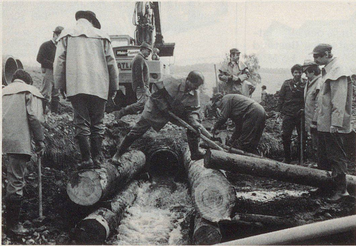
Einsatz des Zivilschutzes zur Nothilfe bei Katastrophen

auf den Plan tretenden Organisationen und deren Verantwortungsbereich bekannt zu machen; dies betrifft insbesondere alle Partner der Gesamtverteidigung. Angesprochen werden müssen auch die Verantwortungsbereiche der Gemeindebehörden, die primär nicht nur Hauptträger des Zivilschutzes sind, sondern jegliche Hilfe bei einem Schadenereignis zu leisten haben.