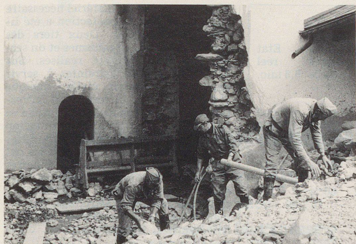
Intervention de la protection civile lors de catastrophes

tection civile ont parfois été mis à contribution par les collectivités publiques, par exemple lors de la construction de chemins forestiers ou pédestres, de l'aménagement de ponts, d'actions de lutte contre les avalanches, de manifestations importantes. Certains ont pu en conclure que la protection civile était en quelque sorte la bonne à tout faire, à laquelle on pouvait faire appel chaque fois qu'une aide quelconque était nécessaire. Même si ce genre d'interventions honore la protection civile et permet de la rendre populaire, il ne faut pas perdre de vue sa mission primaire qui est de protéger la population et les biens contre les conséquences de faits de guerre et, subsidiairement aussi, de sinistres non liés à des conflits armés.