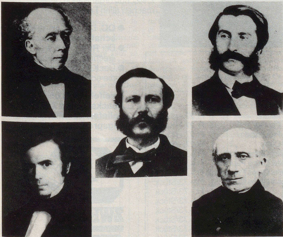
Vor 125 Jahren: Rotkreuz-Komitee eingesetzt Auf Initiative Henry Dunants wurde in Genf vor 125 Jahren, am 9. Februar 1863, das «Fünfer-Komitee» eingesetzt, das heutige Internationale Komitee vom Roten Kreuz (IKRK). Foto: In der Mitte der Rotkreuzgründer Henry Dunant, links oben General Guillaume-Henri Dufour, rechts oben Gustave Moynier, links unten Dr. Louis Appia, rechts unten Dr. Théodore Maunoir.

Genf: Eröffnung des Internationalen Rotkreuz-Museums.