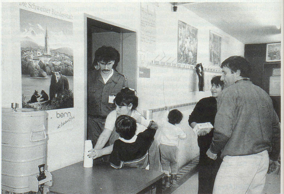
Anlage als Flüchtlingsunterkunft: Verpflegung durch den Zivilschutz möglich.