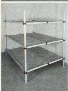
Dreier- und Sechserliegen

Kellergestell in Friedenszeiten. Bequeme Liegestelle im Katastrophenfall, dank integrierter Tuchliegefläche ist KEINE MATRATZE notwendig.