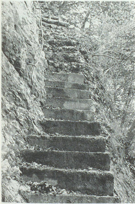
Nicht gesicherter Weg.