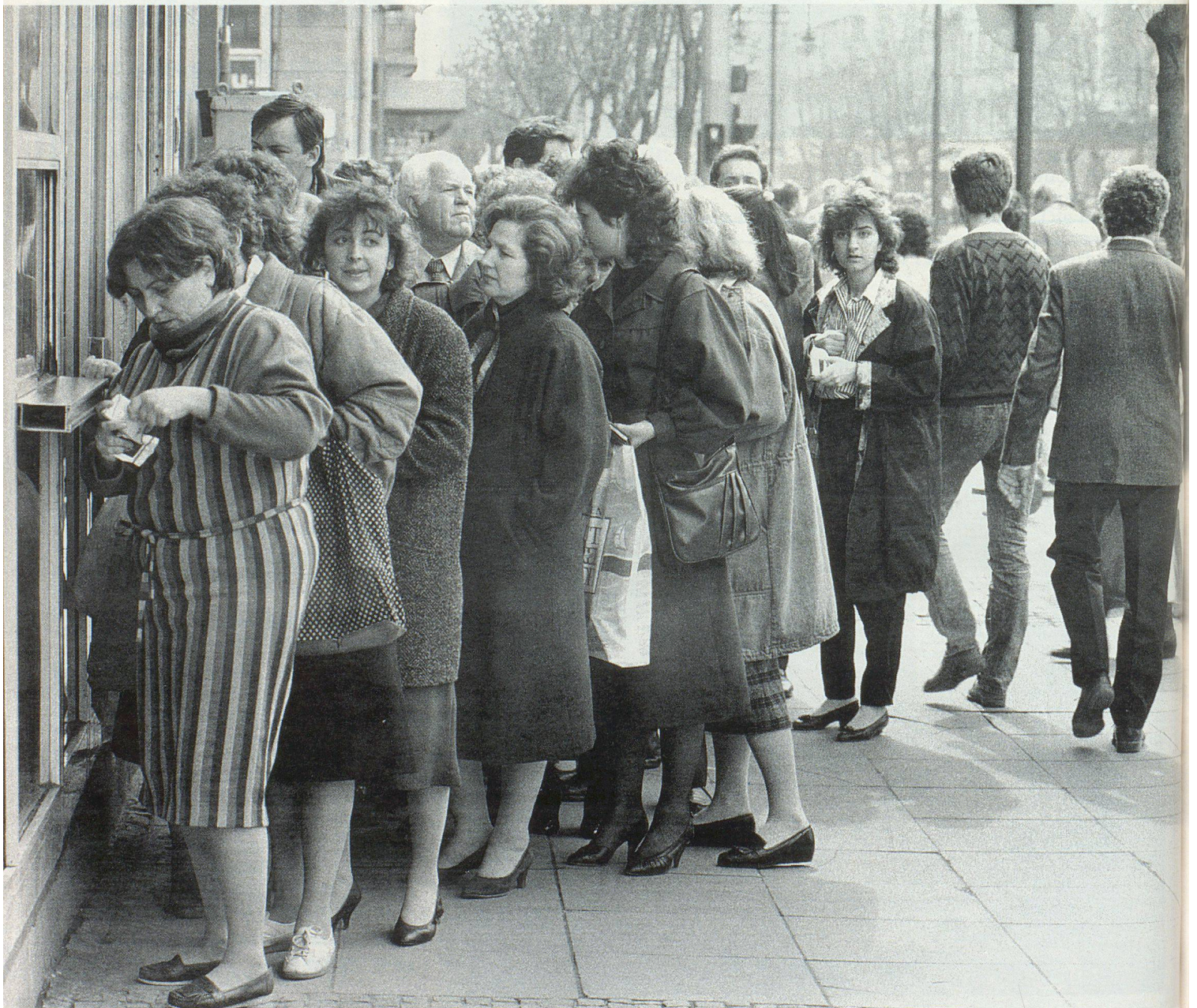
Gewohntes Bild in Bulgariens Hauptstadt Sofia: Schlangestehen vor dem Supermarkt.

tiges Argument dagegen war, dass man mittlerweile wusste, dass Nahrungsmittel, welche – wie die Überlebensnahrung – in Wasser aufgelöst werden müssen, ein Gesundheitsrisiko darstellen, weil in den Entwicklungsländern häufig kein hygienisch reines Wasser zur Verfügung steht. Das hat sich unter