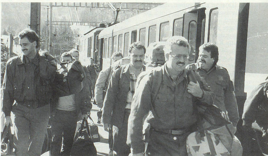
Ankunft eines PBD-Detachementes in Kandersteg.