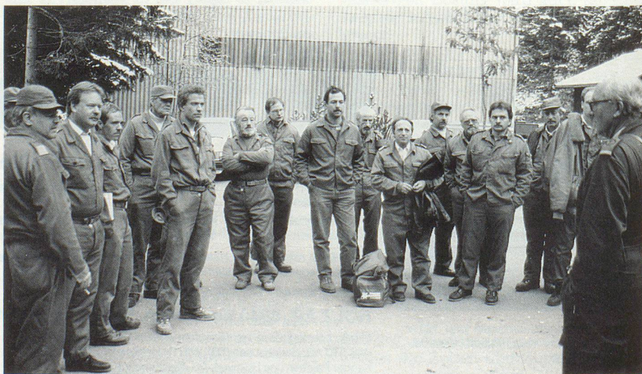
Morgendliches Antrittsverlesen und Befehlsausgabe.