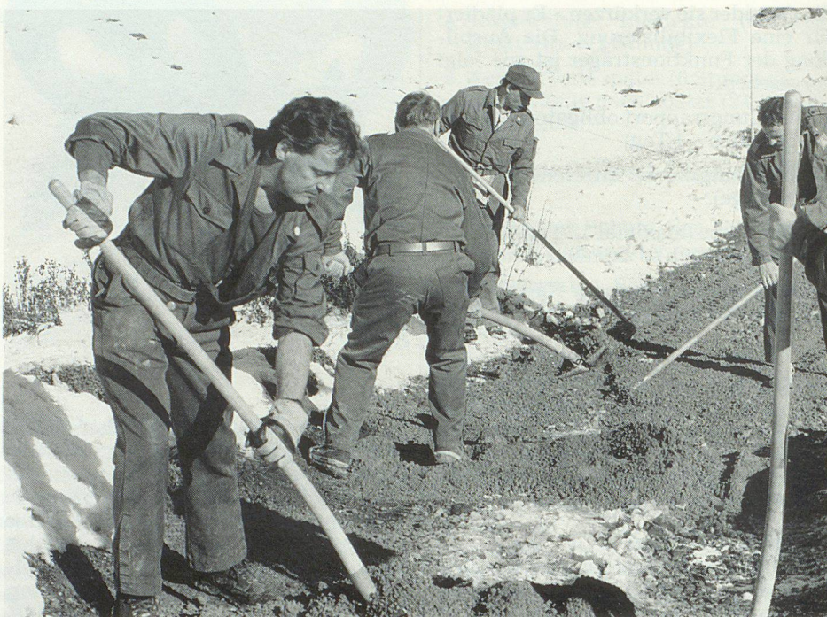
Eine zuvor erstellte Loipe wird mit Kies ausgeebnet und verdichtet.

In der ersten Woche gingen dank idealem Wetter die Arbeiten zügig voran. Über das Wochenende fielen dann im Einsatzgebiet 30 bis 40 Zentimeter Schnee, so dass zu Beginn der zweiten Woche zunächst die markierten oder bereits in Arbeit genommenen Wege freigeschaufelt werden mussten. Zusammen mit dem Kandersteger Wegmeister wurden die neu anzulegenden Wanderwege und Loipen mit Pflöcken und Sägemehl markiert. Dann wurden in mühevoller Handarbeit unter Zuhilfenahme von Schaufeln, Spaten und Pickeln die etwa 80 cm breiten Wanderwege und 1.50 m breiten Loipen angehoben. Hindernisse mussten geräumt werden und um Abrutsche zu vermeiden, wurden sorgfältig Grasziegel angebracht oder Natursteinmauern errichtet. Grössere Gesteinsbrocken wurden gesprengt. Bei diesen speziellen Arbeiten konnten die Dübendorfer auf