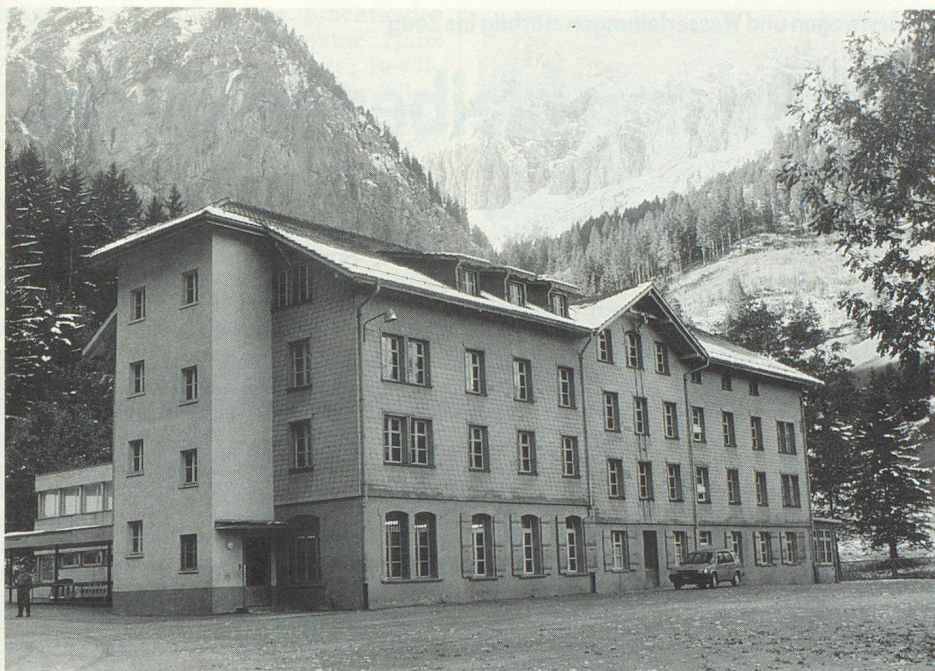
Die Kandersteger Kaserne «Bären» dürfte dem einen oder anderen Ex-Wehrmann noch in bester Erinnerung sein.

die Mitwirkung von einheimischen Fachleuten zählen.